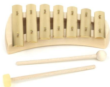
Ilustración 3: metalófono (p. 13)