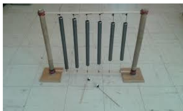
Ilustración 4: Tubos sonoros (p. 13)