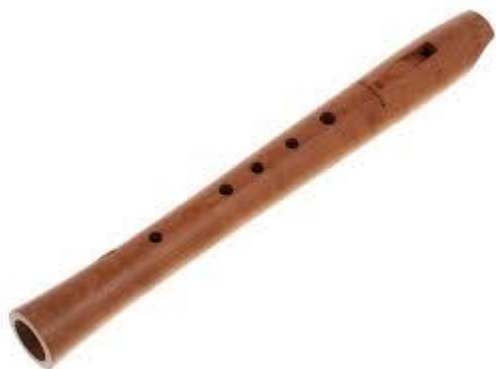
Ilustración 1: Flauta Pentatónica (p. 12)