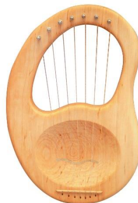
Ilustración 2: Kantele (p. 13)