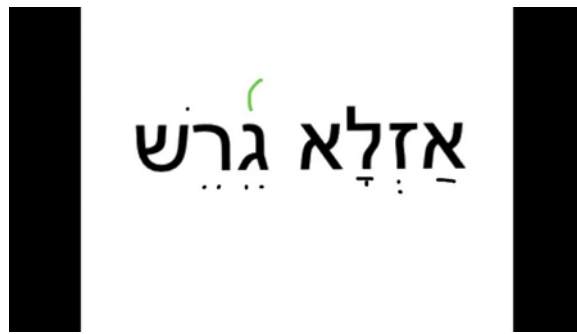
Figura N° 2 caracteres hebreos con signo musical en verde indicando forma de interpretar".

Esto inducía y sugería una interpretación musical con cierta libertad en los grados conjuntos de la escala musical o tetracordio cuando era cantada. También se puede apreciar en el siguiente comentario: